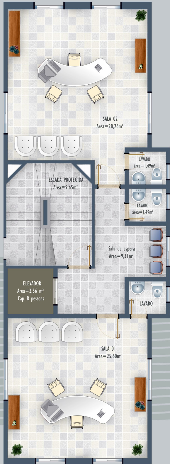
Do 3º ao 6º Pavimento (Tipo)