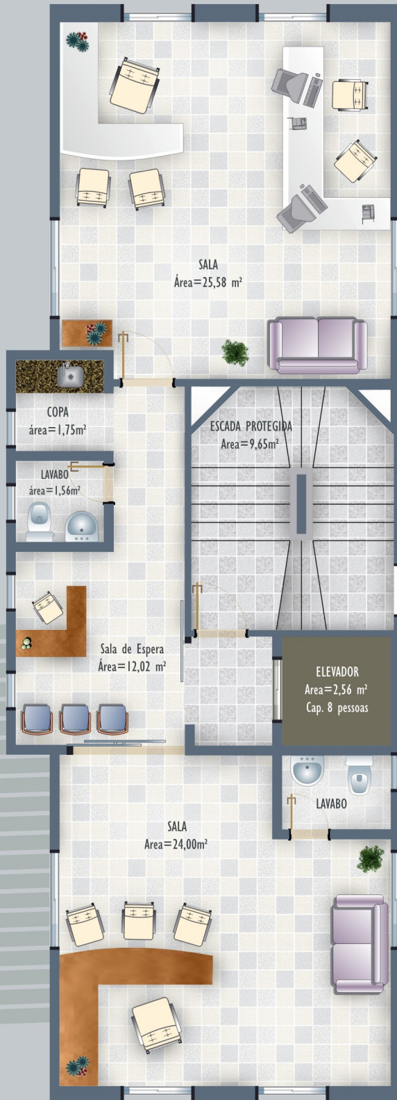
7º Pavimento Diferenciado